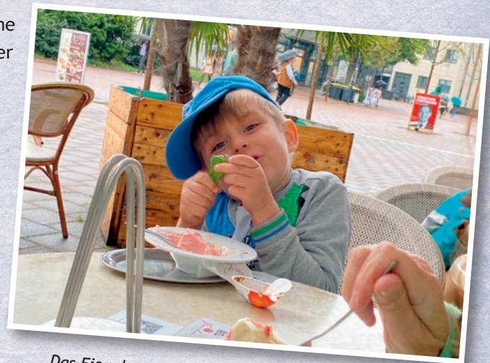
Das Eis schmeckt in Gesellschaft nochmal so gut!

Wie bereits in den vergangenen Jahren, ist unser AKHD Rhein-Sieg auch im Jahr 2021 weitergewachsen. Inzwischen begleiten wir 36 Familien und 53 Ehrenamtliche sind für die Familien und ihre Belange da. Wir freuen uns sehr, dass wir es geschafft haben, über die vielen Monate des persönlichen Kontaktverbots, an der Seite der Familien zu bleiben. Und so war die Freude groß, als es nach den Impfungen in der ersten Jahreshälfte hieß, wir dürfen uns wieder treffen!